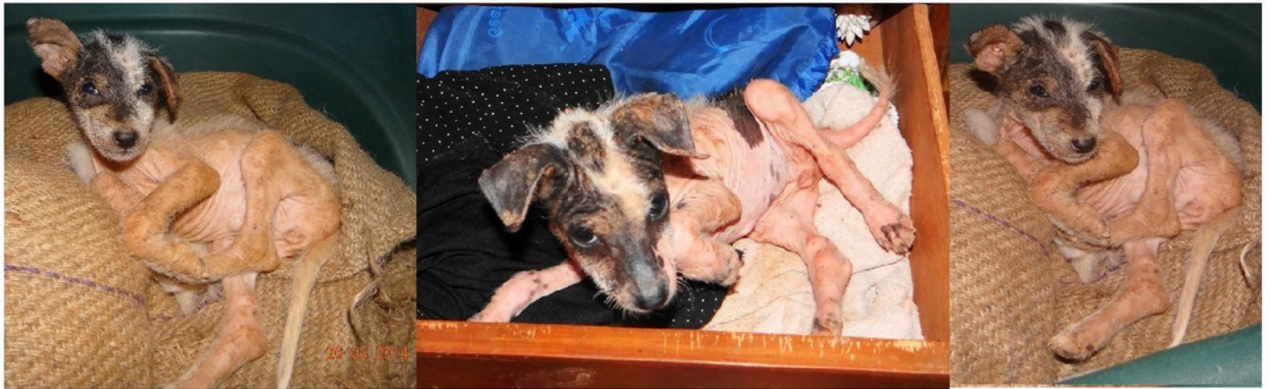
How life can change between 20th March till 11th May 2014.